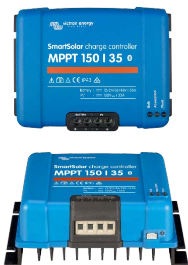
SmartSolar Lade-Regler MPPT 150/35