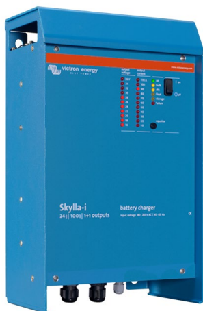
Skylla-i 24/100 (1+1)

Weitere Informationen über Batterien und das Laden von Batterien finden Sie in unserem Buch „Energy Unlimited“ (Uneingeschränkte Energie) (über Victron Energy kostenfrei erhältlich oder zum Herunterladen unter www.victronenergy.com ).