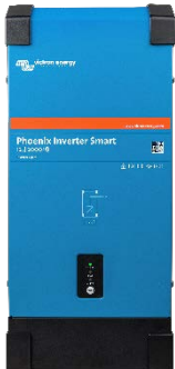
Phoenix Wechselrichter Smart 12/2000